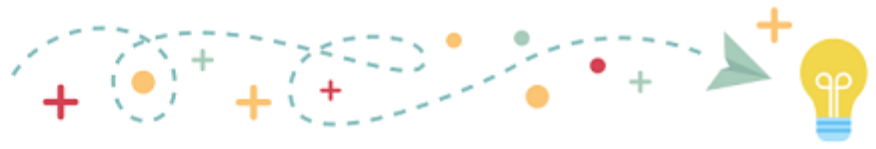
gráfico para organização de conteúdo e layout da tecnologia.